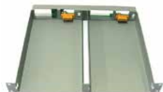
Rack 2 x ZR3048 o 2 x ZR30110