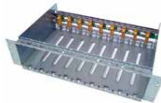
Rack 9 x ZR2048