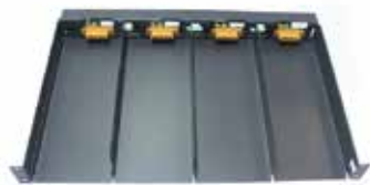
Rack 4 x ZR2048