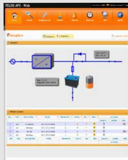
DIAGRAMA DE BLOQUES