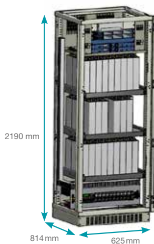
TELSIS ZGR APS 48 V 27 kW *